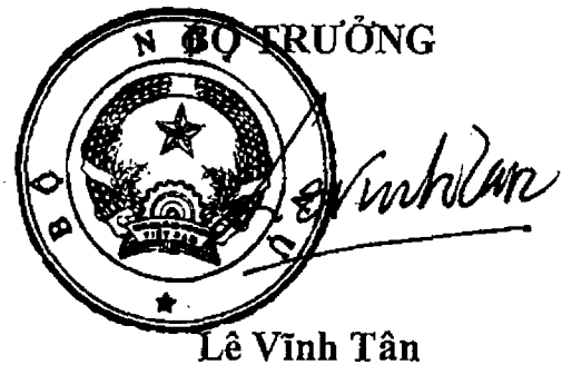
Lê Vĩnh Tân