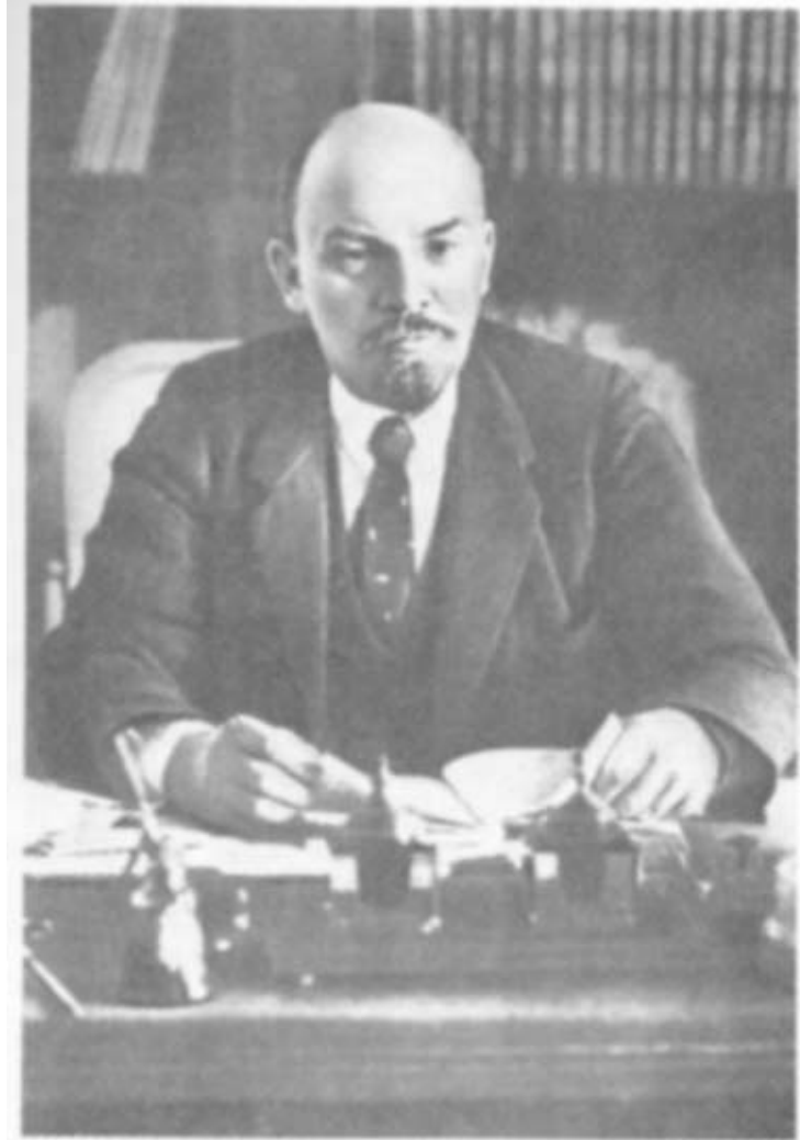
V. I. Lê-nin Tháng Mười 1918