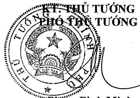
Phạm Bình Minh