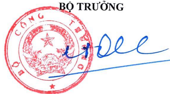
Nguyễn Hồng Diên