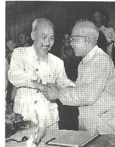
Chủ tịch Hồ Chí Minh chúc mừng Phó Chủ tịch nước Tôn Đức Thắng được bầu tại kỳ họp thứ nhất Quốc hội khoá II, tháng 7/1960