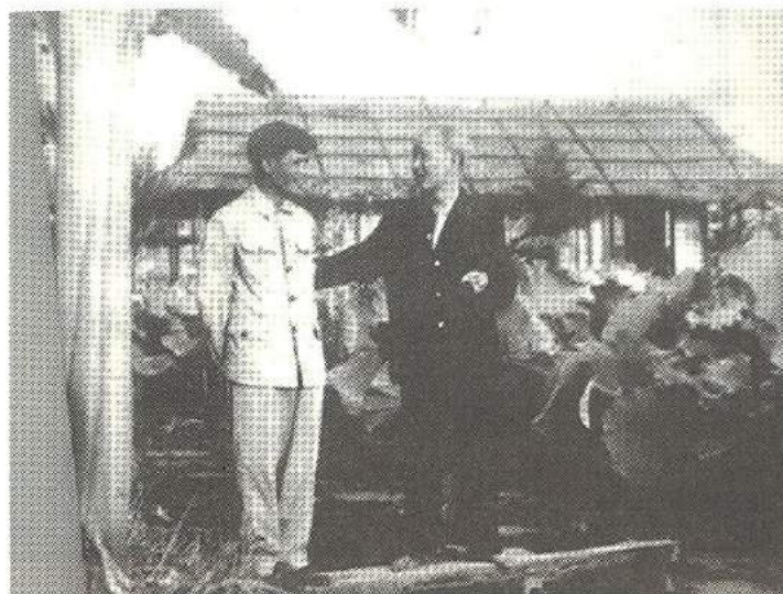
Chủ tịch Hồ Chí Minh thăm và làm việc tại Hà Tĩnh, năm 1964