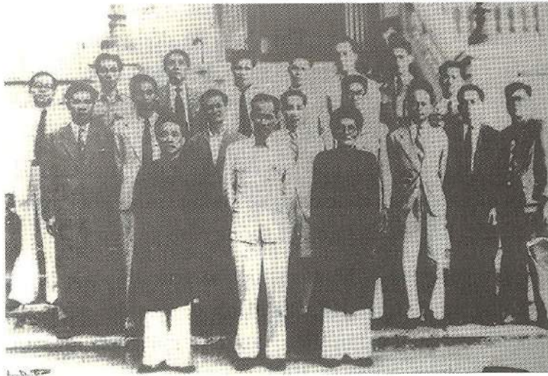
Chủ tịch Hồ Chí Minh và các thành viên Chính phủ Việt Nam Dân chủ Cộng hòa, năm 1946