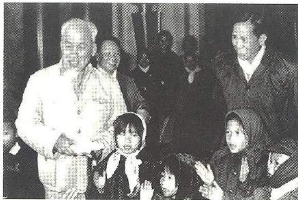
Chủ tịch Hồ Chí Minh cùng các đồng chí Lê Duẩn, Trường Chinh vui đón xuân Mậu Thân với các cháu nhi đồng, ngày 30/12/1967