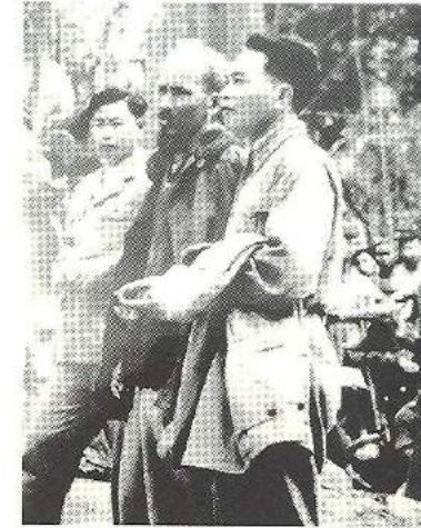
Chủ tịch Hồ Chí Minh, Đại tướng Võ Nguyên Giáp và đồng chí Chu Văn Tấn tại Đại hội Đảng lần thứ II, năm 1951