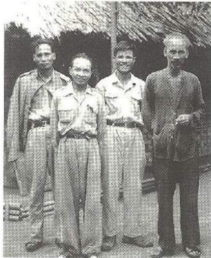
Chủ tịch Hồ Chí Minh, Chủ nhiệm Tổng cục Chính trị Nguyễn Chí Thanh, Tổng Bí thư Trường Chinh, Phó Thủ tướng Phạm Văn Đồng (từ phải sang trái) ở Việt Bắc, năm 1951