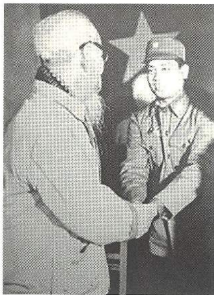
Chủ tịch Hồ Chí Minh và Anh hùng Nguyễn Văn Cốc, năm 1969