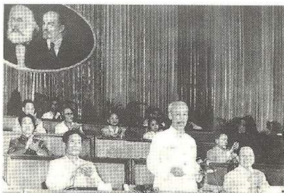
Đại hội lần thứ III Đảng Lao động Việt Nam, ngày 5/9/1960