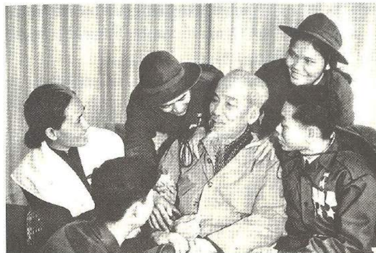
Chủ tịch Hồ Chí Minh với các anh hùng và dũng sĩ miền Nam, năm 1969