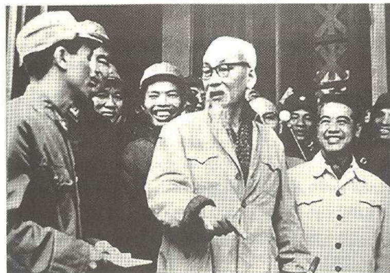
Chủ tịch Hồ Chí Minh thăm đơn vị tên lửa chiến đấu giỏi, sản xuất giỏi, năm 1969