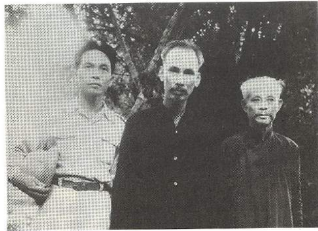
Chủ tịch Hồ Chí Minh tại Lễ phong quân hàm Đại tướng cho đồng chí Võ Nguyên Giáp tại Việt Bắc, ngày 25/5/1948