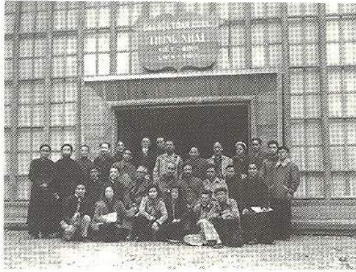
Chủ tịch Hồ Chí Minh và Phó Trưởng ban Thường trực Quốc hội Tôn Đức Thắng cùng các đại biểu dự Đại hội thống nhất Việt Minh - Liên Việt chụp ảnh lưu niệm, tháng 3/1951