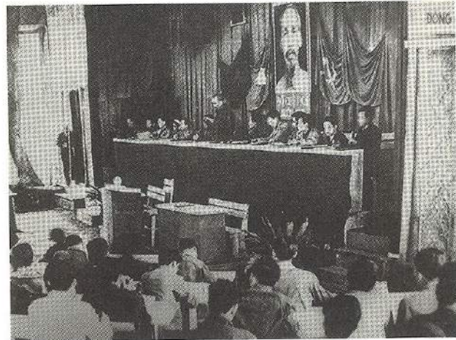
Chủ tịch Hồ Chí Minh đọc báo cáo chính trị tại Đại hội lần thứ II của Đảng, tổ chức tại xã Vinh Quang, huyện Chiêm Hóa, tỉnh Tuyên Quang, tháng 2/1951