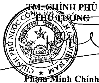
Phạm Minh Chính